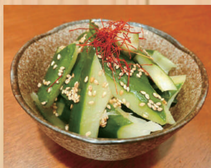
Smashed Cucumber たたきキュウリ $4.80