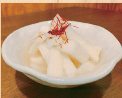
Pickled Yamaimo $6.80 山芋の浅漬け