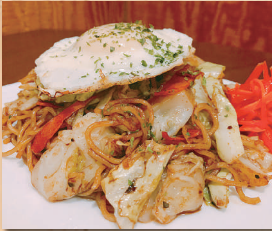
Yakisoba (Regular or Salt) 焼きそば (Regular) $12.00 塩焼きそば $12.00