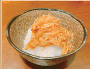
Grated Rasish w/nametake なめ茸おろし