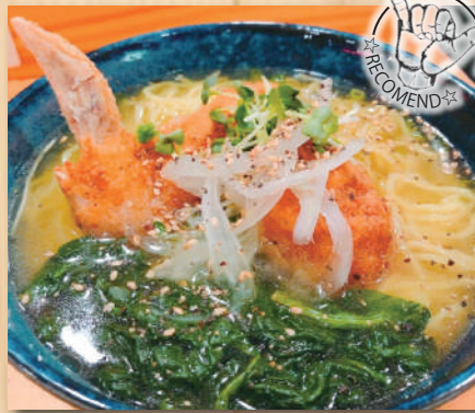
Fujiyama Ramen (Yuzu Garlic Ramen w/ Chicken Wing) フジヤマラーメン $15.00