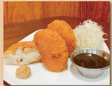
Homemade Croquette 自家製コロッケ (2pcs) $8.00