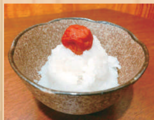
Grated Rasish w/plum 梅おろし