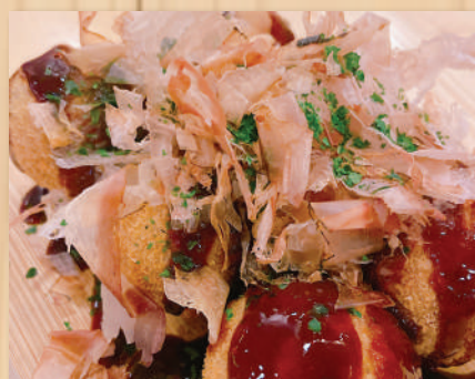
Fried Tako-yaki $11.20 揚げたこやき(6 pcs)