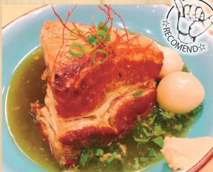
Simmered Pork Belly $9.80 トロトロ豚の角煮