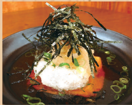
Fried Mochi w/Dashi Soup $8.20 みぞれもち