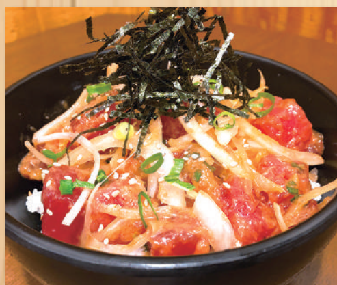
Ahi Poke Bowl $13.20 アヒポケ丼