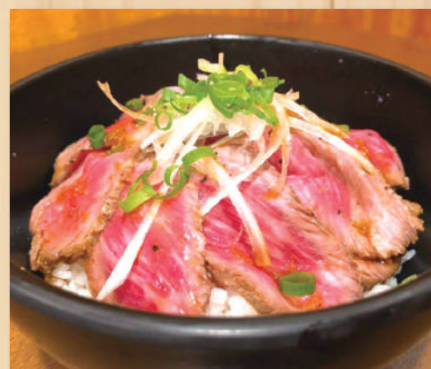
Beef Tataki Bowl $15.20 牛たたき丼