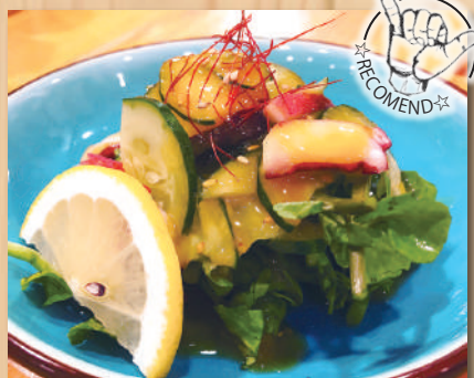
Tako w/miso vinegar $9.20 タコの酢味噌和え