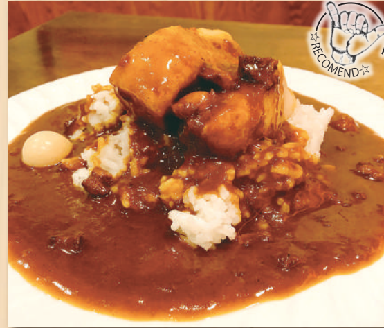
Simmered Pork Curry $18.20 豚の角煮カレー Curry Rice カレーライス $12.00