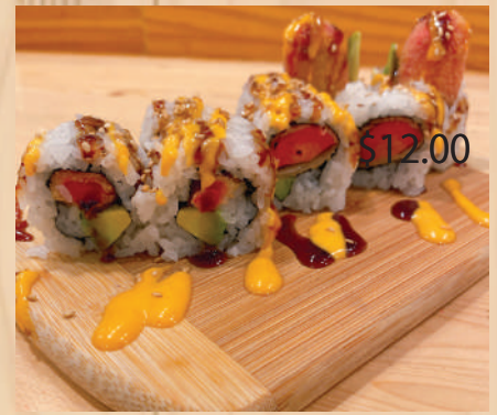
Hawaiian Kushi Katsu Roll ハワイアン串カツロール $8.90