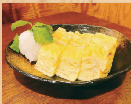
Rollled Japanese Omelet $7.90 出汁巻き玉子