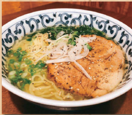
Yuzu Garlic Ramen 柚子ガーリックラーメン $12.00