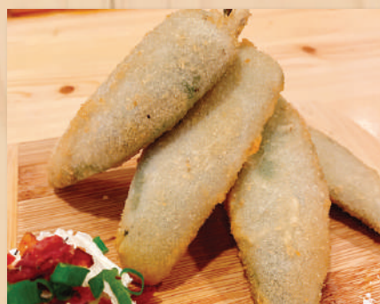
Jalapeño Popper $10.00 w/cream cheese sauce ハラペーニョ ポッパー