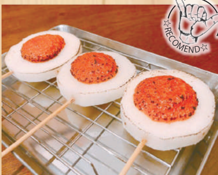
Yamaimo Mentai $9.50 山芋めんたいのせ