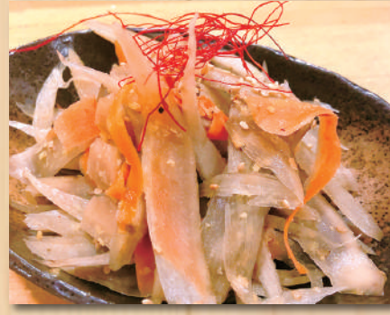
Braised Burdock Root きんぴらごぼう $7.00