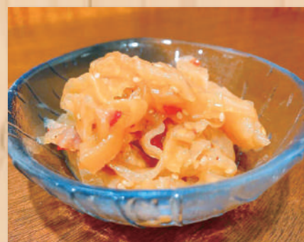
Jellyfish $5.80 中華クラゲ